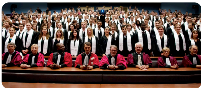
Les nouveaux Docteurs accompagnés des Professeurs